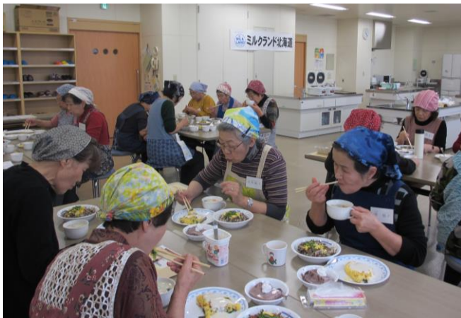
↑ 出来上がった料理を試食中！