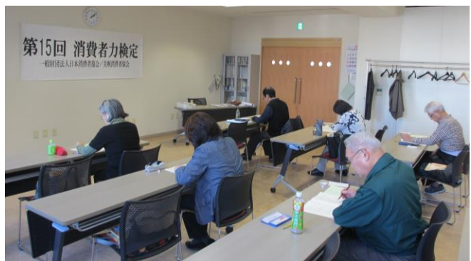
(第15回消費者力検定)