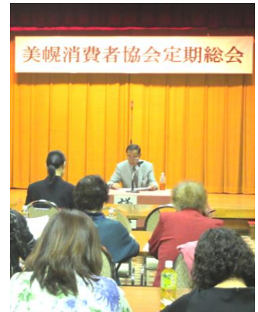
↑上杉議長により議事が進められました。