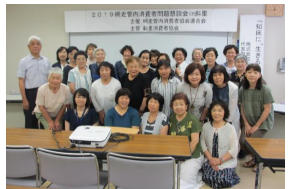
↑ 参加された美幌消費者協会の会員

←斜里消費者協会の皆さん手作りの「エゾ鹿肉ミートボールのカレーライス」を美味しくいただきました。