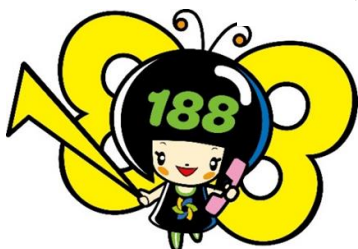
消費者庁 消費者ホットライン188イメージキャラクター「イヤヤン」