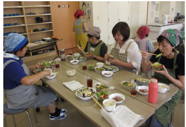
↑出来上がった料理を黙食で試食

作りたい人気メニューで、今夏のような猛暑続きにはスタミナ料理としてピッタリでした。次回の牛乳料理教室は 11 月 18 日(土)に予定しています。皆様の参加をお待ちしています。(畑)