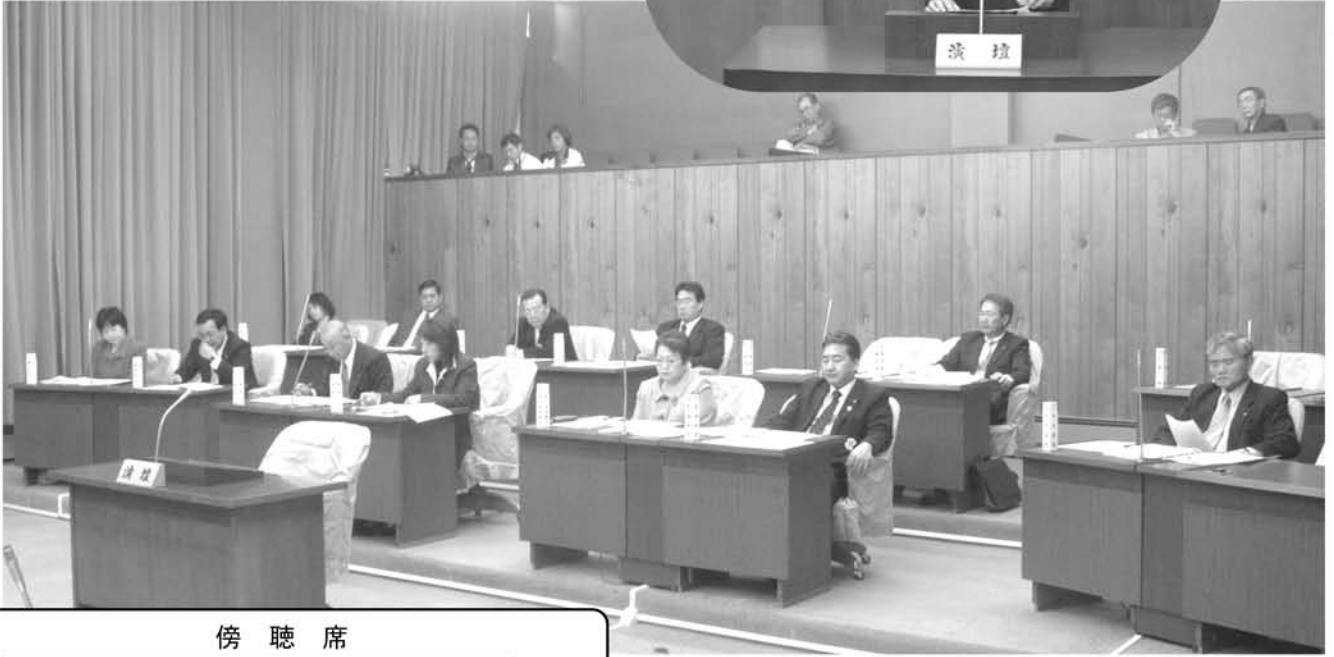
5月8日 平成19年第3回臨時議会から