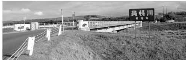
町道第1号の一部が道道に昇格

町道路線の認定 町道第1号の一部(コミセ)を美幌バイパス瑞治入口を道道に昇格し整備することに伴い、その交換として道道から降格となる区間(道道北見美幌線の一部)を新たに町道第770号として認定するもの。