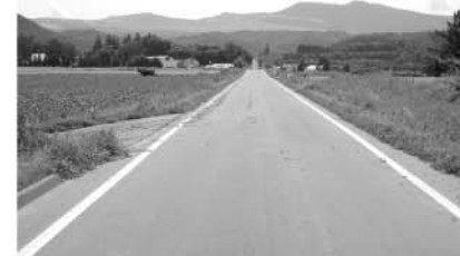
第2福梅地区支線農道改良・舗装工事

辺地の指定を受けた地域が公共的施設の整備を行う際に財政上の特別措置として有利な起債が受けられるが、そのためには当該地域の総合整備計画を作成し、議会の議決を経て総務大臣に提出する必要がある。