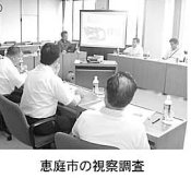
恵庭市の視察調査

また、平成16年度からは市負担により市内の小中学校に専任の司書や図書館スタッフとともに各小学校への図書導入とともに年間2千円の手算措置するなど、子どもへの読書活動を積極的に推進していること、読書を通して学校や地域社会における想像力や表現力、さらには人とのコミュニケーションスキルを上手にできる子どもを育てる狙いがありました。