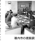
稚内市の視察調査

市は、市内の私立幼稚園に施設整備を働きかける一方で、施設整備が不可能な地帯については公立で低年齢児を、私で幼保園児を受け入れて計画を持っており、将来の保育ネットワークを支える地域ネットワークを築くことに加え、地域・市民・子育て家庭の結び付きを深めるための事業が数多く展開されており、本町においても参考にできる取り組みを知ることができました。