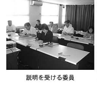
説明を受ける委員

また、平成16年度からは市負担による教員を採用（1年の期間限定）し、市内の大規模小学校4校に教員を各2名配置し、小学3・2年生の30人以下学級を実施するとともに、小学3級6年生の特定科目で少人数指導を実施しています。教育現場からは事業継続を求める声がありますが、平成19年度終了後に総合的な検証を行い、今後の事業継続を判断することの説明でした。