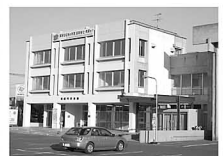
町長 小破修繕等を行いながら利用率を高めていきたい。