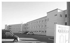
整備が進む旭公営住宅