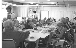
町長 緑の苑の運営の維持や、介護や福祉サービスの提供が考えられる...

高齢社会に対応し、時代に合った介護サービスを継続的に提供していくには経営移譲が最善策と判断した。