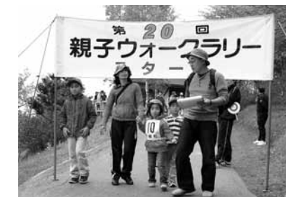
5/25 親子ウォークラリー大会