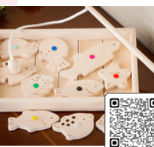
木のおもちゃ 魚釣りセット