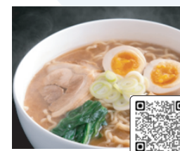
かにみそ 生ラーメン15食入り