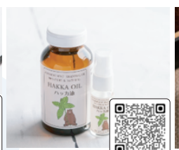
ハッカ油 200ml セット