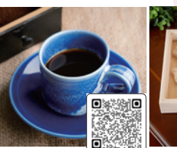
オホーツク焼 コーヒーカップ