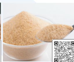
北海道まるやか てんさい糖7個セット