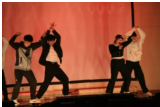
有志による「フリーパフォーマンス」