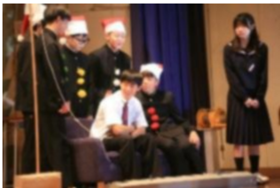
2年生演劇「真夏のサンタクロース」