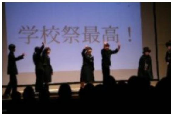
生徒会書記局による「オープニングセレモニー」