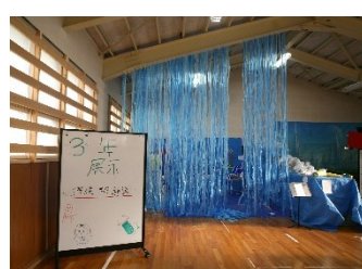
3年展示「未来の地球問題」