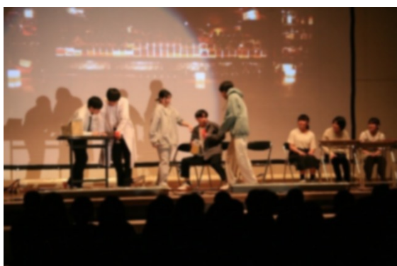
3年生演劇「大切なもの」