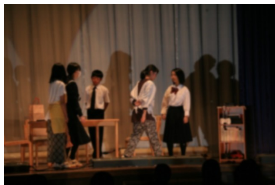
1年生演劇「真昼の星」