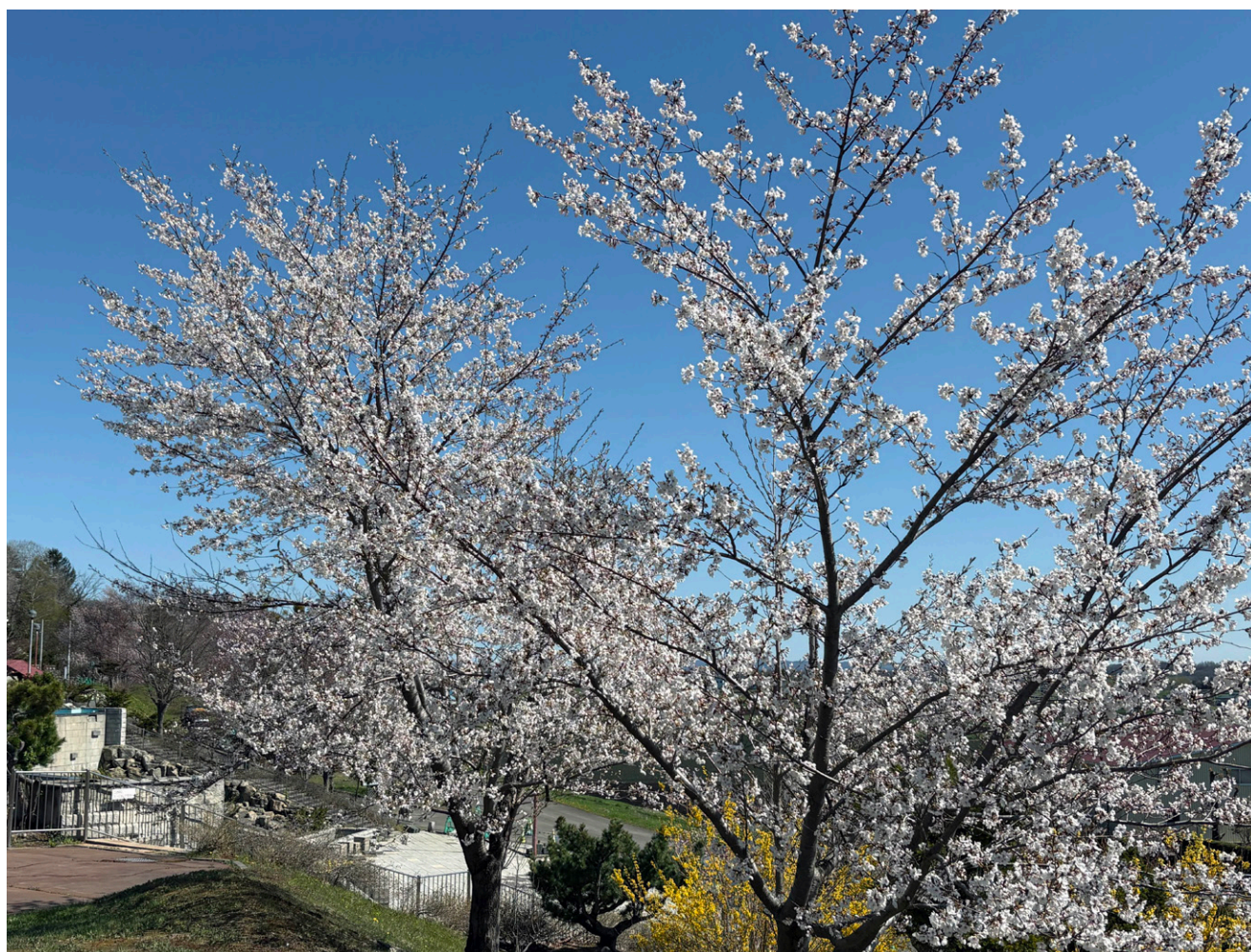
八重柏誠《今年のサクラ》