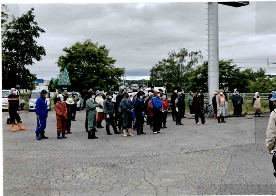
6月12日 花植栽ボランティア