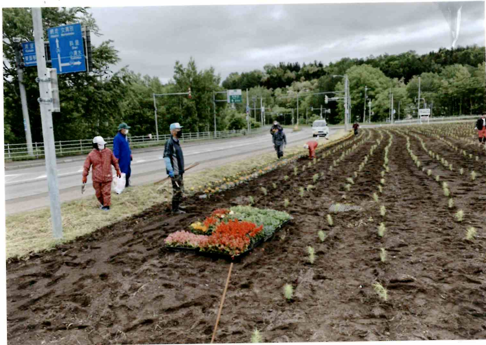
6月12日 花苗の植栽ボランティア