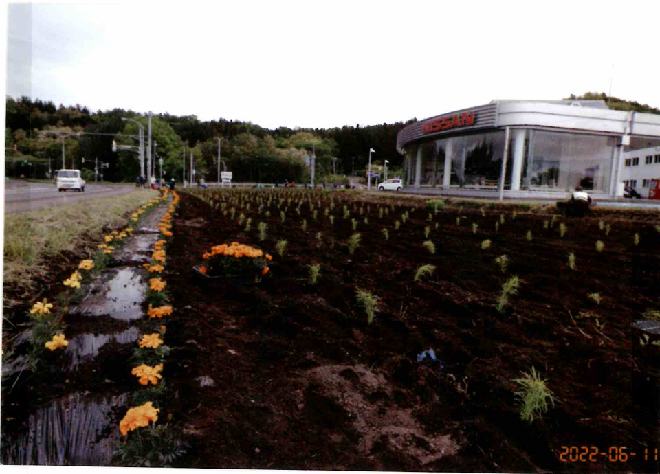
6月12日ボランテック植栽