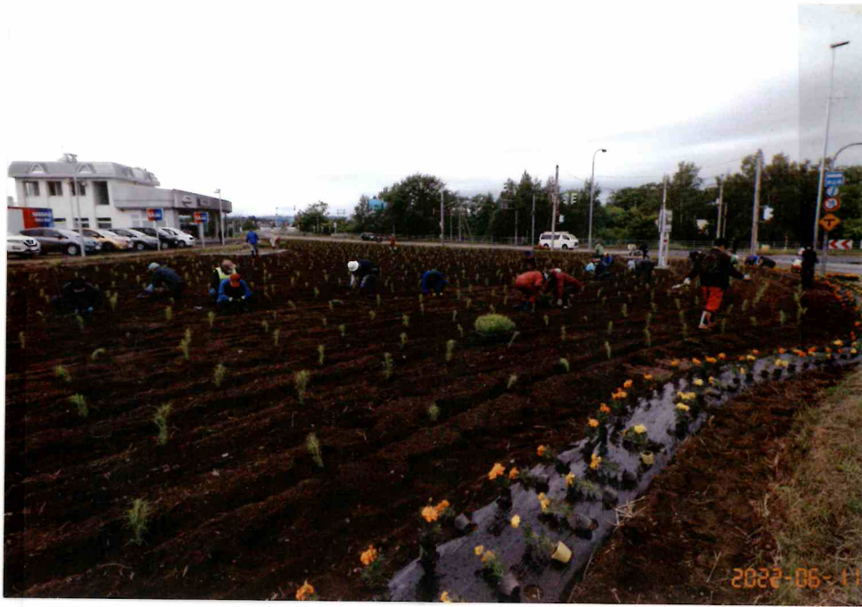
6月12日ボランテック植栽